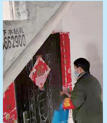
挨家挨户爬楼梯入户宣传