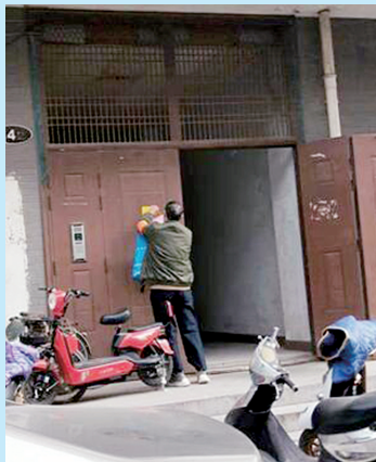
单元门口粘贴疫情防护措施