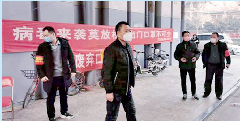
每天带领大家进行登记排查