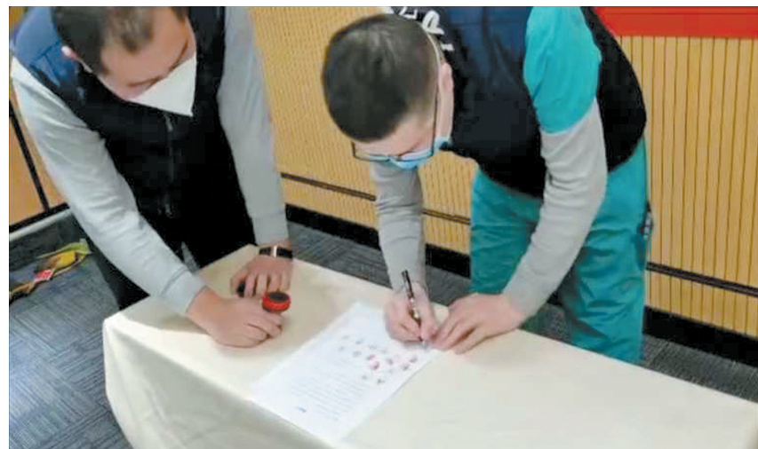
河南省人民医院男护士签请战书

本报讯(郑报全媒体记者 邢进 通讯员 张晓华 文/图) 昨日下午,随着武昌方舱医院正式宣布休舱,武汉14个方舱医院全部休舱,医护人员终于可以暂时松一口气。但是,休整了还不到一天的河南省人民医院护理男团的20名男护士集体再请战,请求继续到武汉各个医院救治新冠肺炎危重症患者。 在抗疫一线,男医生、男护士拥有先天优势。河南省人民医院派出的30名支援湖北医疗队成员清一色均为男性。其中,护理团队共20人,均为来自急诊和重症医学科室的临床经验丰富的男护士。他们于2月9日随同河南第五批支援湖北医疗队来到武汉,进驻青山方舱医院,近一个月的时间里,共收治519名新冠肺炎患者,治愈372人。 3月9日,青山方舱医院休舱,医疗队所有医护人员原地休息待命。听说武汉各个医院还有大量需要救治的危重患者,需要有经验的重症护士,尤其是能熟练操作ECMO、PICCO等各项技能的护