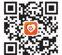
扫描二维码 下载“心通桥”客户端

呼吁大家戴口罩、勤洗手,测体温、勤消毒,少聚集、勤通风,拒野味、不聚会,亲友情、网上叙,少出行、莫大意。 疫情防控、噪声扰民、占道经营、停车乱收费、道路不通、路灯不亮……如果您遇到这些烦心事,可扫描二维码下载“心通桥”客户端获得帮助。