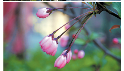
碧沙岗公园海棠花