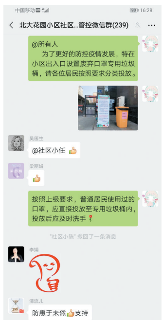
依托微信平台传达防疫要求