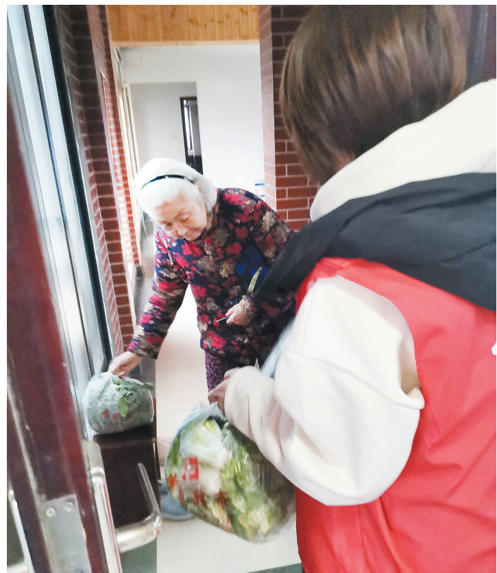
志愿者将居民预约采购的蔬菜送上门

“社区治理管控微信平台”为如意湖辖区居民搭建了一个与时俱进、高效便捷的新平台，它将社区治理和便民服务渠道从现实扩宽到网络，将基层政府与民交流时间延伸至8小时外。“指尖的互动”代替了“脚步的活动”，有效加快了办事处的办事效率，让社会发展的成果更好惠及辖区居民，让居民生活更有获得感、幸福感。