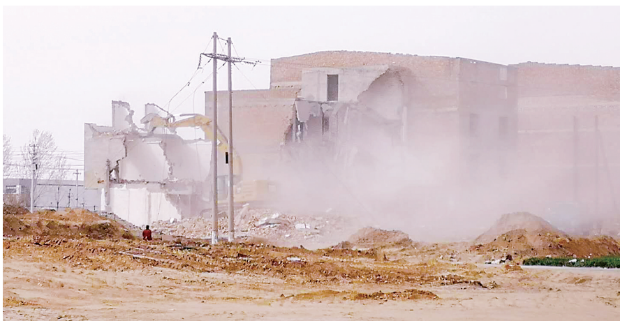
中牟郑庵镇商业街拆迁项目工地

本报讯(郑报全媒体记者 翟宝宽 文/图)3月18日,记者跟随郑州市污染防治督导组联合执法六处,督查郑东新区、中牟县扬尘污染防治落实情况,发现多处项目工地存在违规土石方作业、大面积未作业面黄土裸露等问题。当天共督查项目7处,发现问题6处,现场开具交办单4份,口头交办2处。