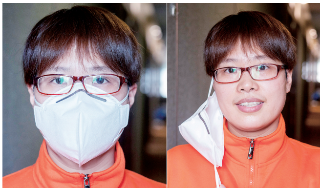
医疗队队员离开武汉前,摘下口罩拍照留念