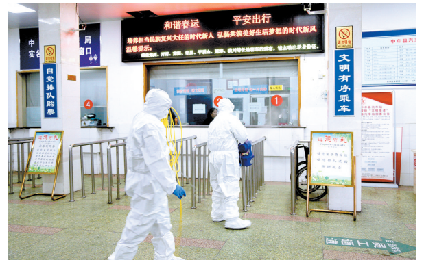
消杀队员对汽车站售票厅预防性消毒