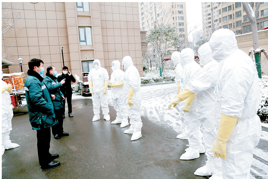
防疫站工作人员在店家门前讲解消杀事宜