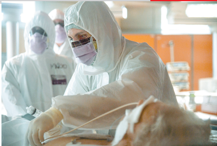
在意大利罗马收治新冠肺炎患者的卡萨帕洛临床研究所,医护人员在重症病房工作。

美国:美国约翰斯·霍普金斯大学公布的最新统计数据显示,截至美国东部时间28日18时40分(北京时间29日6时40分),美国新冠肺炎确诊病例增至121117例,死亡病例2010例。