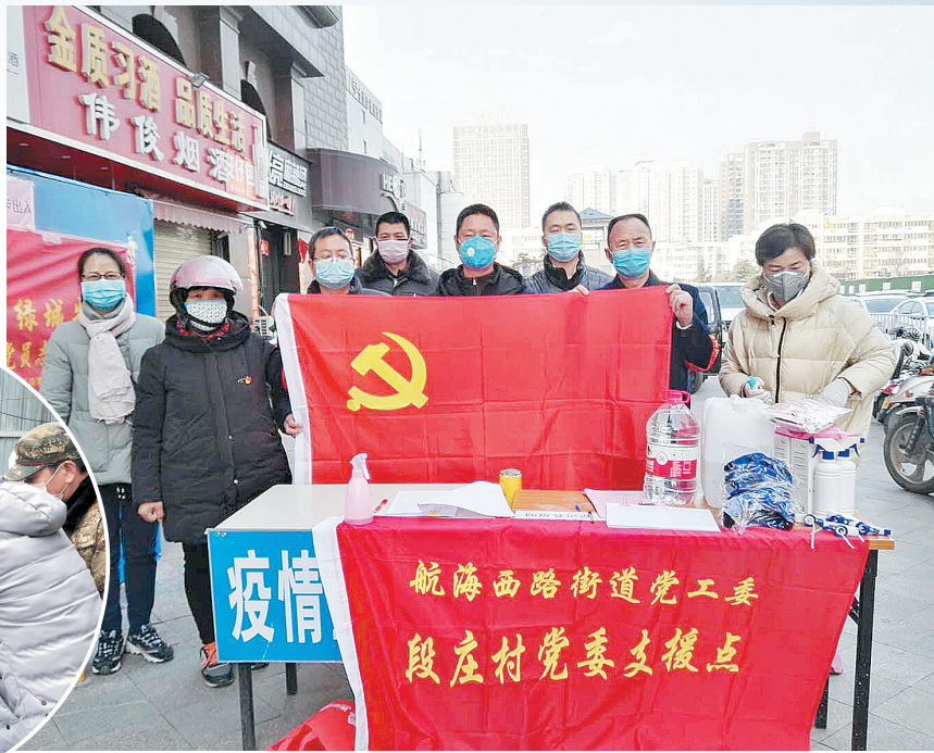
党员自发参与卡点岗位值守、居民信息登记等工作