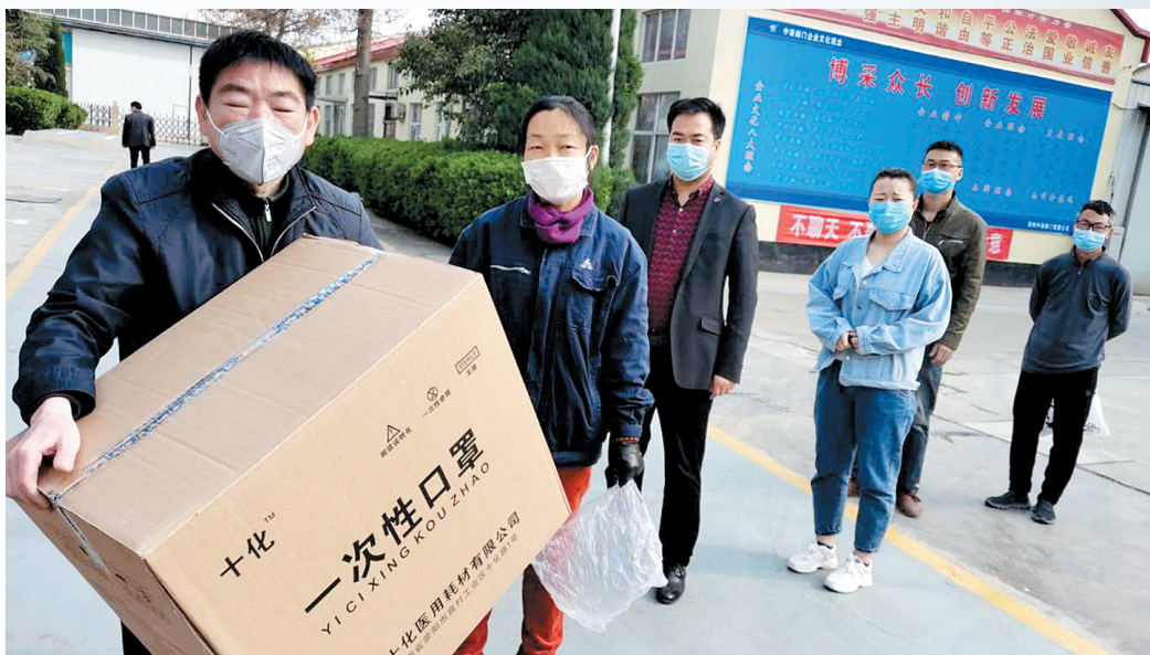
帮助企业增添防疫物资

与此同时,乔楼镇强化宣传引导,构建群众防线。乔楼镇将疫情防控期间郑州市和荥阳市发布的所有公告,提炼成简明扼要的文字,印发成“口袋书”,发放给全镇疫情防控一线的所有工作人员,要求熟读熟记,认真遵照执行,并规范值守行为,文明开展防疫工作。印发1万份《致全镇居民一封信》,制作横幅300条,利用微信群、宣传车、入户走访等多种形式,宣传国家疫情防控的最新要求和科学防护知识,督促群众提高思想认识,自觉遵守闭环管理的相关规定。采取“早发现、早报告、早隔离、早治疗”措施,组织镇、村组干部、派出所民警、村医对辖区居民疫区接触史全面排查,登记造册,做到无遗漏、无死角。