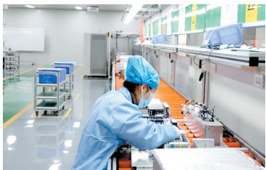
虎克电梯无尘车间