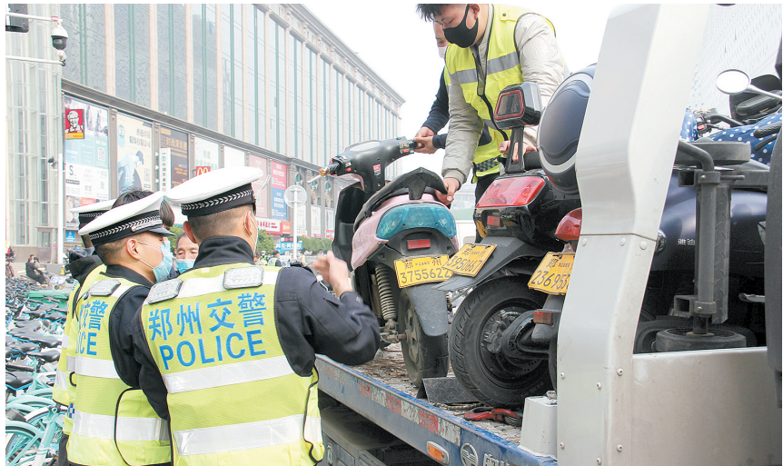
拖移违法非机动车

本报讯(郑报全媒体记者 汪永森 实习生 刘地 通讯员 韩黎剑 杨晨曦文/图)昨日,郑州交警三大队联合南关街办事处、一马路办事处、管城区执法局和周边商场交通志愿者及安保人员,全