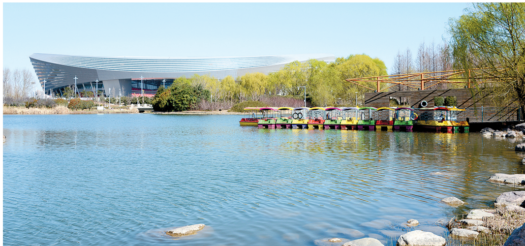
“四个中心”美景。

2019年,中原区上下高举习近平新时代中国特色社会主义思想伟大旗帜,全面贯彻习近平总书记视察河南重要讲话精神,准确把握市委的定位、要求和希望,围绕打造以郑州中央文化区(CCD)为引领的国家中心城市产城融合示范区,着力推进“四个中原”建设,把握机遇、扛稳责任,拼搏实干、克难攻坚,全区经济保持稳中有进、稳中向好的良好态势。 记者 张改华 通讯员 王耀祖 张光明