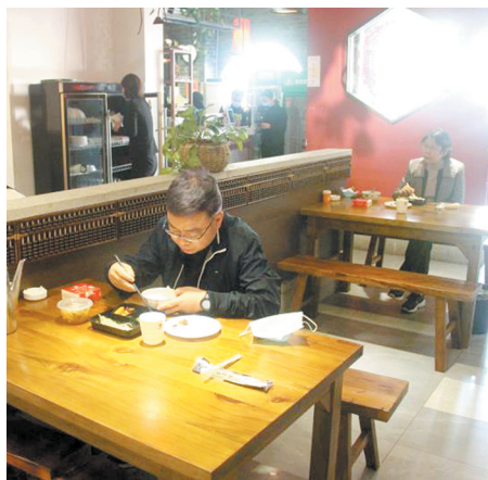
郑东新区优化服务、加强排查、创新举措,深入开展“三送一强”活动,除隐患、强服务、保食安,助力餐饮业加速复工复产,守护群众“舌尖上的安全”。 记者 马燕