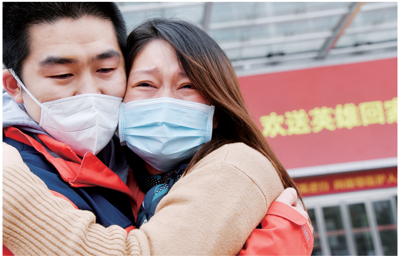
与君相拥,泪飞顿作倾盆雨