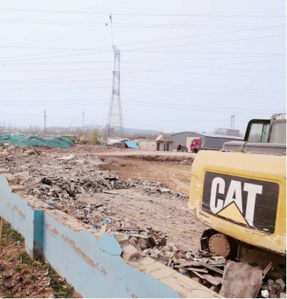
金水源办事处华美石材路道路工地

二七区金水源办事处金水河源生态修复工程 现场搅拌混凝土;两台钩机土石方作业未湿法;无扬尘在线监测系统;无车辆出入冲洗设施。