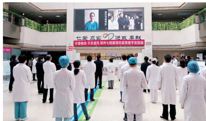
郑州市第七人民医院援鄂医疗队凯旋

九龙办事处辖区各村把党支部设在了疫情防控第一道关卡上,各村(社区)疫情监测检查站分别悬挂党旗、入党誓词。包村领导、村(社区)“两委”干部、党员骨干关键时刻不畏艰险、挺身而出,带头分片包干,分兵把守,24小时分班轮值,始终确保“阵前党支部”充满战斗力,党员骨干靠前指挥,时刻坚守在疫情第一线。支部书记及时发声指导,果断采取行动,全面落实联