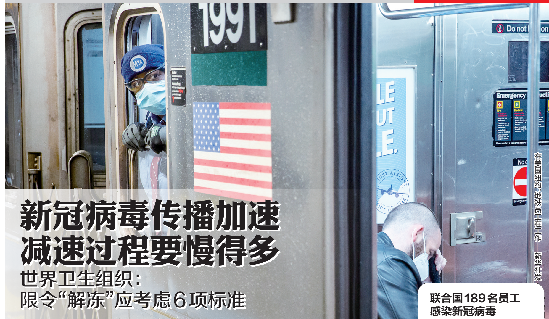
在美国纽约地铁员工在工作