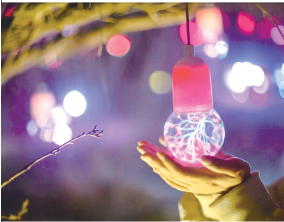
如梦如幻的夜游灯光秀

本报讯(郑报全媒体记者 成燕 文/图)记者昨日从郑州樱桃沟景区了解到,该景区将于4月18日起恢复开放。届时,全新打造的“豫见·樱桃沟”夜游灯光秀项目也将于当晚起试开放。