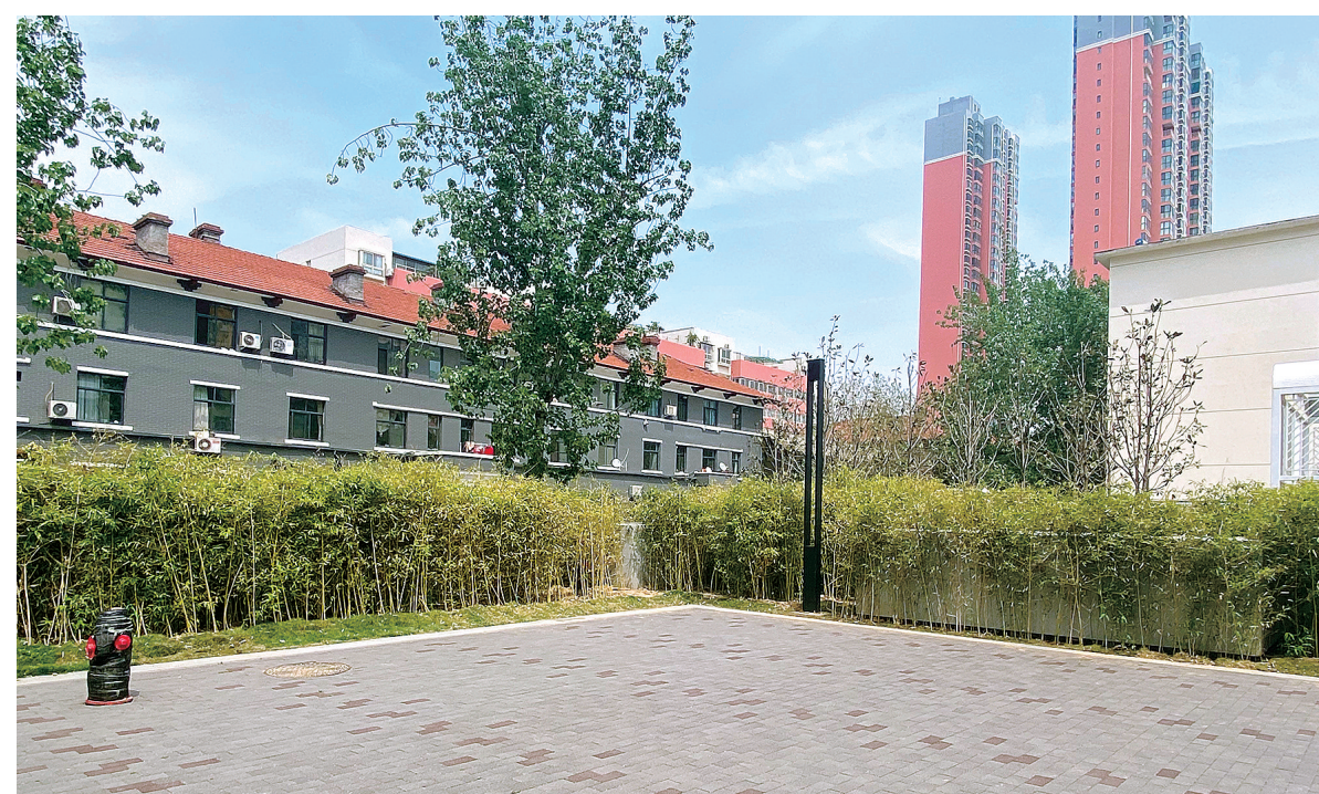
棉纺路三厂家属院门前绿意盎然

棉纺路街道以老百姓的需求为基本出发点,紧贴实际,统筹规划,科学施策,狠抓落实,力争“过五关”,全面做好老旧小区综合改造工作。