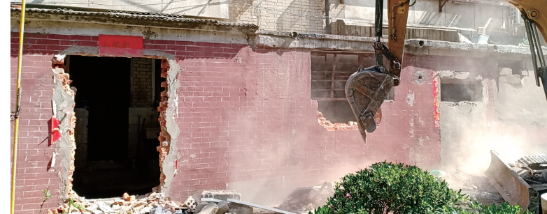
棉纺路街道老旧小区改造

垃圾分类难的问题,辖区内6个老旧小区全部进驻垃圾分类运营公司,加大分类知识宣传力度,引导居民树立垃圾分类意识,建立健全社区、公共机构、物业、运营公司等多方联动机制,进一步改善老旧小区环境。