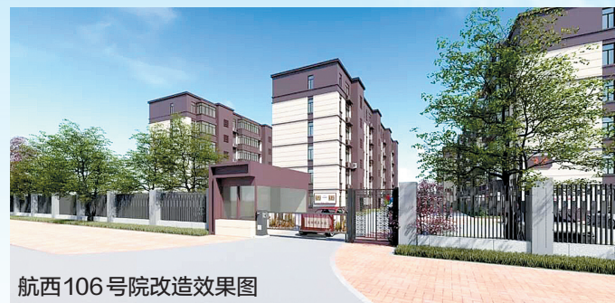
航西106号院改造效果图

老旧小区改造是一项民生工程。航海西路街道改造项目开展以来,航西106号院改造工作组一直坚持“以人为本”的工作导向,征集居民意见,公开改造方案,听民意、解民忧。