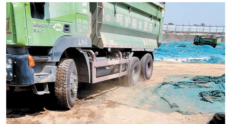
上街区熙樾坊工地黄土裸露扬尘比较严重

本报讯(郑报全媒体记者 裴其娟 文/图)4月28日,记者随市污染防治督察组联合执法四处督查惠济区、上街区、荥阳市部分项目,其中四环线及大河路快速化工程1标、上街区峡窝镇金华路南段熙樾坊2个项目被录入惩戒系统。