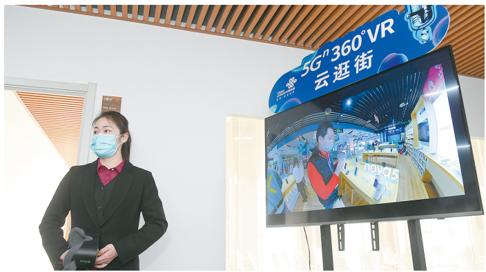
云逛街在疫情期间快速成长为新的直播方式

疫情虽然打乱了人们的生活节奏，但在抑制消费的同时也激发出许多新的需求。面对新的市场变化，我市也在积极出台政策，挖掘培育消费新业态，持续拉动经济回暖复苏。 郑报全媒体记者 赵柳影/文