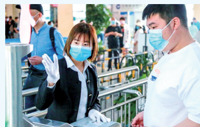
景区有序引导游客参观

本报讯(郑报全媒体记者 成燕文/图)网络预约、客流实时监测调控……今年五一假期,河南“智慧旅游”大显身手,省文旅厅指导景区通过“掌游中原 老家河南”智慧小程序、12306平台等,引导管理游客。