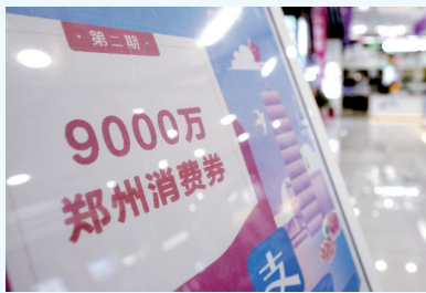
消费券有很强的带货能力

本报讯(郑报全媒体记者 赵柳影/文)以“券”促消费,正在我市产生积极影响。昨日,记者从市商务局获悉,五一期间,我市餐饮券核销225万元,拉动消费1794万元,拉动比1:8。购物消费券核销2477万元,拉动消费2.07亿元,拉动比1:8.4,对消费回暖效果明显。