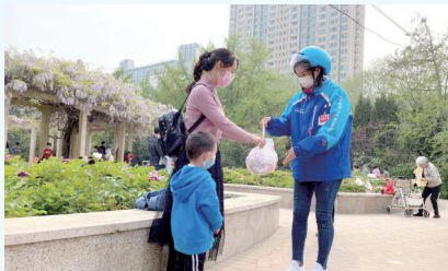
外卖直接送到公园游客手中

本报讯(郑报全媒体记者 肖雅文/图)火锅、奶茶、烧烤、小龙虾……外卖直接送到公园草坪上。昨日,记者从饿了么了解到,五一假期全国各地公园的外卖订单环比4月同期翻倍增长,郑州送到公园附近的外卖订单环比4月增长2.7倍。