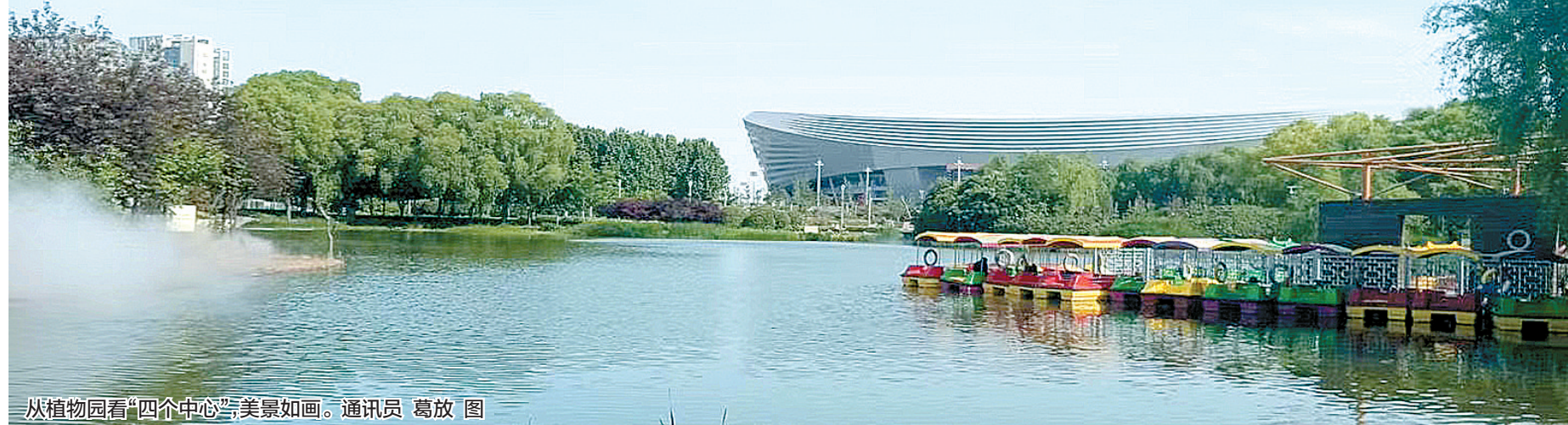
从植物园看“四个中心”,美景如画。