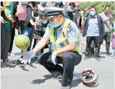
实验表明,西瓜掉地上与地面擦滑破损

本报讯(郑报全媒体记者 汪永森 见习记者 刘地 通讯员 韩黎剑 杨晨曦 文/图)昨日,郑州交警三大队民警在银基商圈通过多种形式开展“一盔一带”宣传教育活动,促进广大交通参与者养成佩戴安全头盔的习惯,降低交通事故中的伤亡风险。