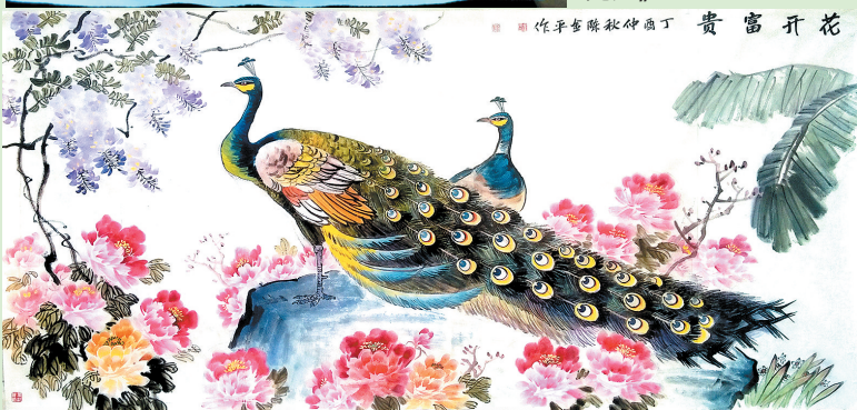
▲陈金平绘画作品《花开富贵》