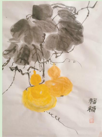
▲琴心绘画作品《福祿》