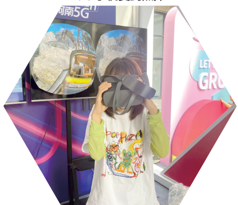
身临其境体验VR游戏