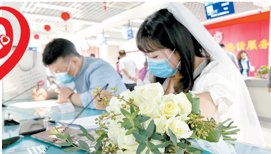
昨日,新人们在二七区婚姻登记处填写资料