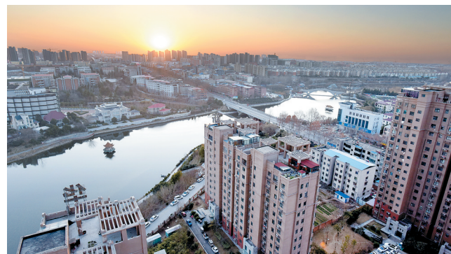
朝阳普照郑韩大地

“新故相推,日生不滞。”站在新起点,向未来出发,没有最好,只有更好。 记者 杨宜锦