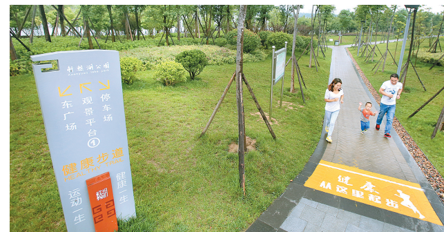
一家三口慢跑在轩辕湖畔