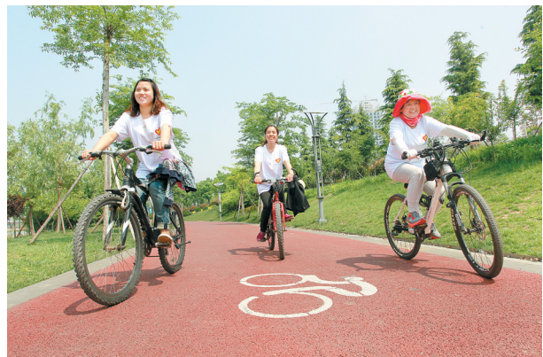
市民在自行车道享受骑行乐趣