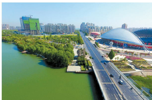
新郑北区轩辕湖碧波荡漾,湖畔公园植被浓郁,宽敞的中华北路两旁住宅和商业高楼林立,气势恢宏的体育场成了新郑市民健身的最佳场所