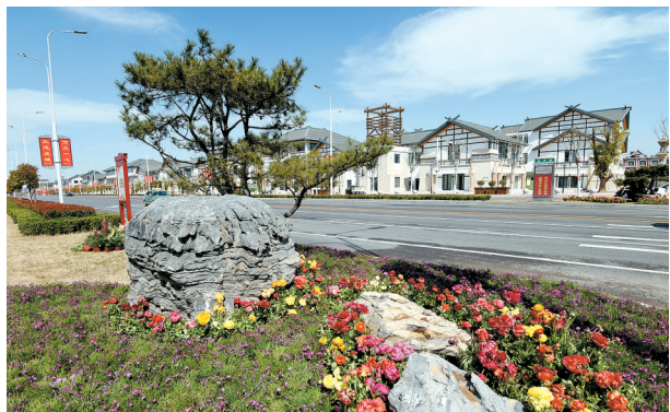
以鲜花、苍松、奇石装扮的郑新快速路隔离带,为市民出行增添了美的视觉感受

本报讯 阳光、沙滩、绿树、微风……这些只有在海边才能欣赏到的美景,如今在新郑新区就能真实体验到。新区建成以后,道路通畅、景色宜人。漫步在波光粼粼的轩辕湖畔,触摸着新郑新区激昂的心脉,可以感受到一座经济发达之城、创新创业之城、绿色宜居之城、魅力人文之城、和谐幸福之城正在崛起。