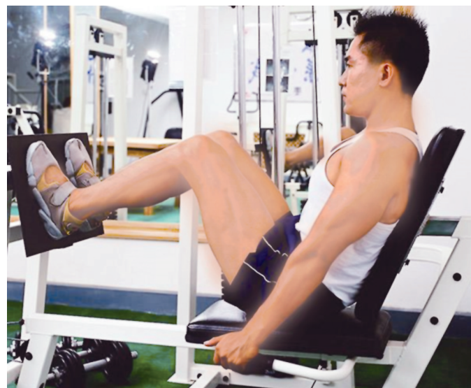
越来越多的市民群众开始走到户外或是健身场馆进行身体锻炼

本报讯(郑报全媒体记者 陈凯 文/图)随着郑州市新冠肺炎疫情防控持续向好,越来越多的市民群众开始走到户外或是健身场馆进行身体锻炼,那么人们在这些地方强身健体的同时如何保证安全科学?昨日,记者从郑州市体育局获悉,郑州市新冠肺炎疫情防控领导小组近日出台了《郑州市体育健身场馆复工开放工作指南》,为我市广大人民群众安全科学参与全民健身提供了权威指引,同时也为我市体育健身场馆有序复工开放制定了权威标准。