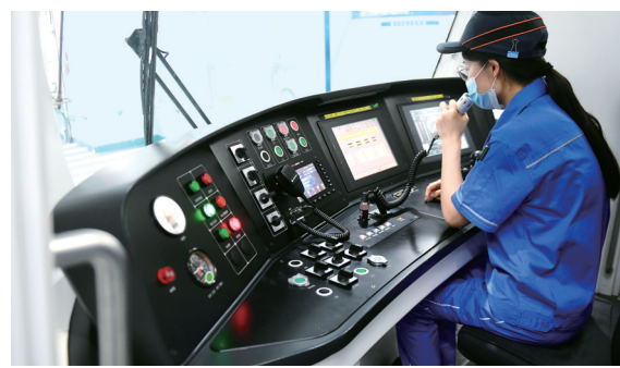
济南地铁列车驾驶舱