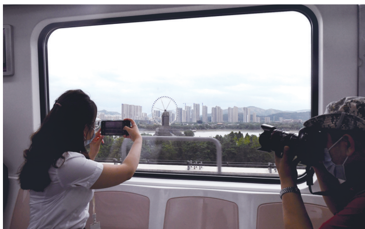
地铁上拍车窗外济南美景

经过多年的努力,济南从地铁时代迈向了初步成网运营时代。此次全国主流媒体采访团走进济南建成及在建地铁线,现场体验济南地铁人脸识别购票、WiFi全覆盖等智慧地铁服务,了解建设施工团队在丰富的地下泉水中攻克多个全国性难题的创新和奋斗故事。