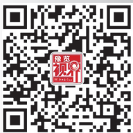
扫码关注 豫览影像