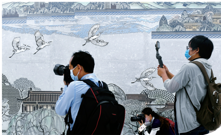
济南地铁站内的文化墙