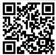
扫码欣赏 更多精彩