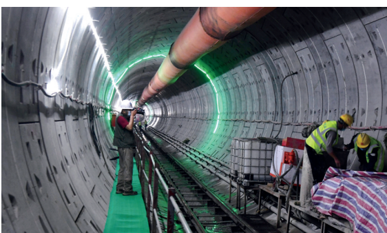
隧道内壁灌浆作业防泉水渗透