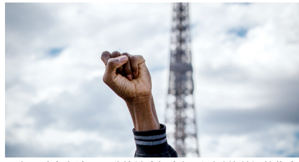
一名示威者在法国巴黎战神广场参加反对种族歧视的集会

在纽约,数千民众在中央公园、布鲁克林等地集会,随后汇集至曼哈顿中城开始游行,突如其来的大雨也没有驱散抗议人群。本周以来,纽约市已有约1400人在抗议活动中被逮捕。近两日来,骚乱和抢劫已较少见,部分民众和官员呼吁取消1日以来每晚8时至次日5时的宵禁,但纽约市长德布拉西奥坚持将宵禁持续至本周一。 美国费城、洛杉矶、达拉斯、新奥尔良等地也举行了规模不同的抗议、示威和祈祷活动。 此外,澳大利亚、捷克、法国、塞内加尔等国民众6日纷纷走上街头,抗议在美国发生的针对非洲裔群体的种族歧视行为。南非总统拉马福萨当天表示,南非人民支持全美反种族歧视斗争。