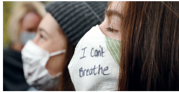
一名女子戴着“我无法呼吸”字样的口罩在英国伦敦集会