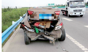
午后开车犯困,追尾致前车三厢“秒变”两厢

本报讯(郑报全媒体记者 张玉东 通讯员 刘珺 文/图)6月7日下午2时许,在郑州机场高速13公里东半幅,因后车司机犯困发生追尾事故,致前车三厢“秒变”两厢,所幸两车人员均系安全带,未出现伤亡情况。