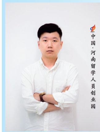
中国·河南留学人员创业园