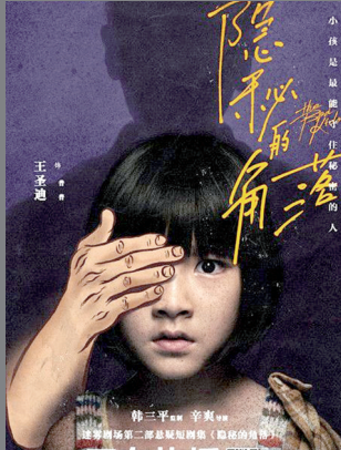
涉案悬疑剧扎堆儿上阵 片方供图