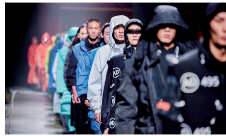
“开门见山”情景秀让人耳目一新

本报讯(郑报全媒体记者 郭韬略文/图) 6月21日晚,由特步集团与少林功夫非遗传承人联合打造的“开门见山”情景秀在嵩山脚下上演,这台以“金功夫之美,重塑运动潮流”为主题的演出,为武术注入了更多时尚元素,给人耳目一新的感觉,同时也为第二天就将开放的嵩山少林景区起到了“预热”作用。