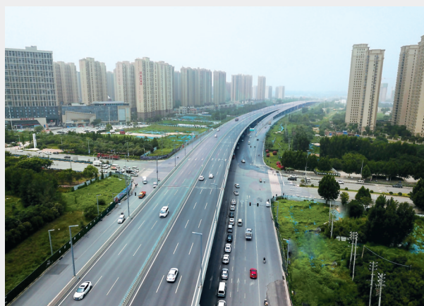
南四环高架桥试通车 记者 丁友明 图