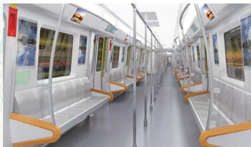
地铁3号线列车车厢