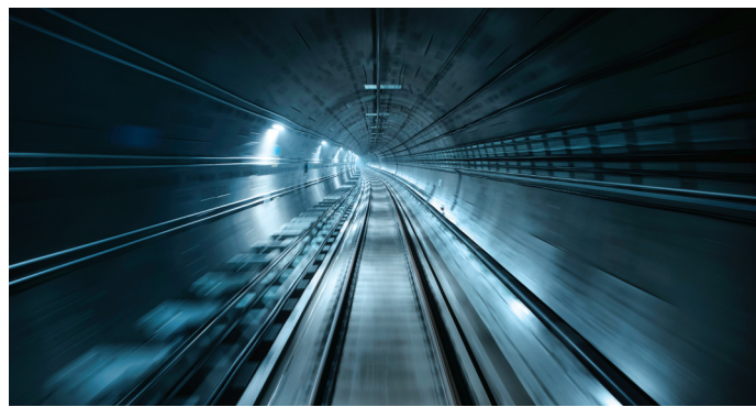
地铁3号线试跑成功

本报讯(郑报全媒体记者张倩 通讯员周静雯 文/图)试跑成功!昨日上午9时,郑州轨道交通3号线一期工程海滩寺站至省体育中心站正线6站5区间“热滑”试验正式开始。 经过6个小时“热滑”试验,地铁3号线电客车运行平稳,供电、接触网、车辆及轨道等系统运行稳定,采集的试验数据表明电客车受流状态良好,证明了地铁3号线一期工程正线该区段已经具备电客车的开行条件,也标志着可进入到下一联合调试阶段,距离正式开通初期运营又