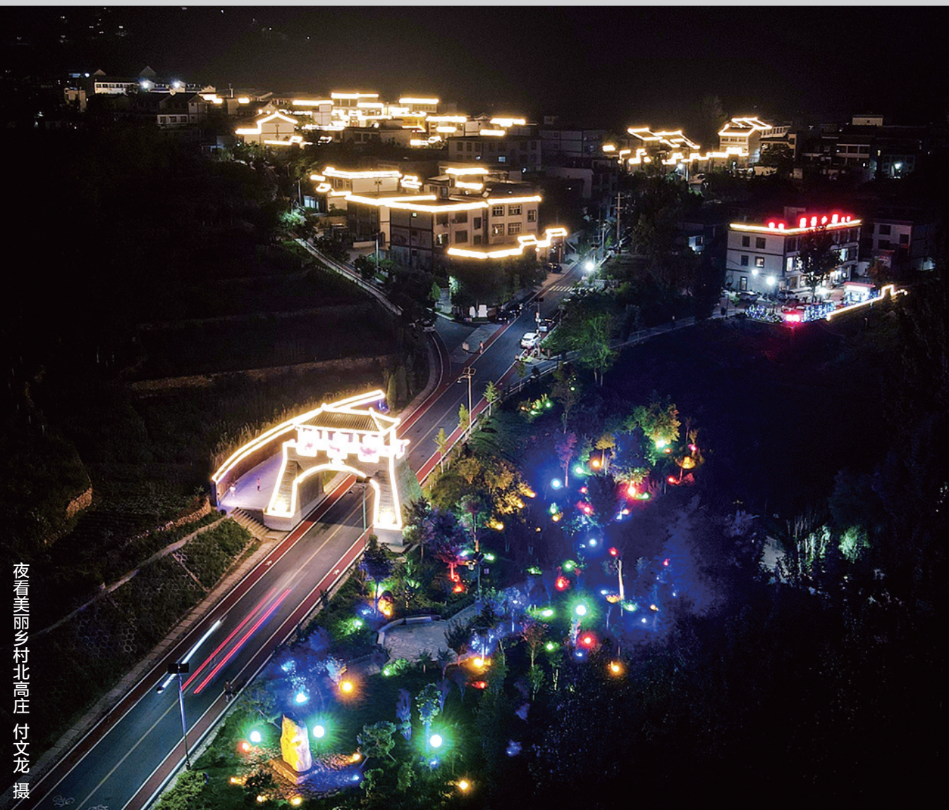
夜看美丽乡村北高庄