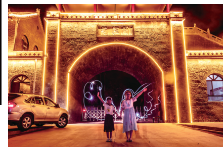
范家门前的“小天使”