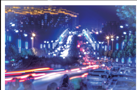
热闹非凡的高阳桥