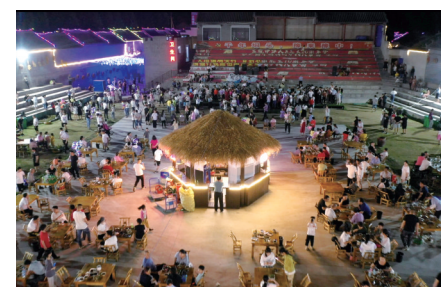
夜晚洞头村民乘凉处