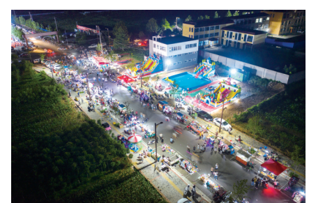
颍阳镇的夜市一条街