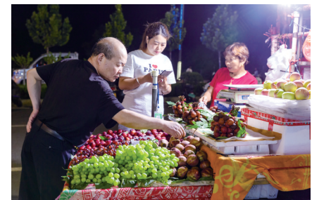
夜逛高阳桥上水果摊的色彩