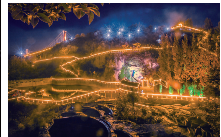
山顶上的美丽山村范家门