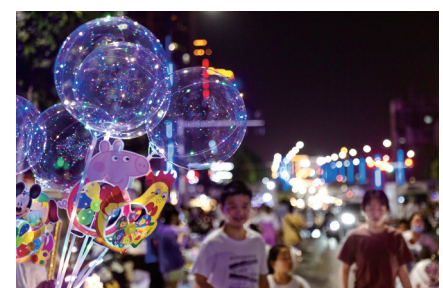
高阳桥的灿若星河