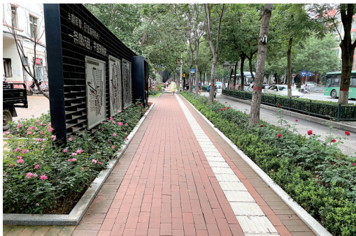
棉纺路文化气息越来越浓