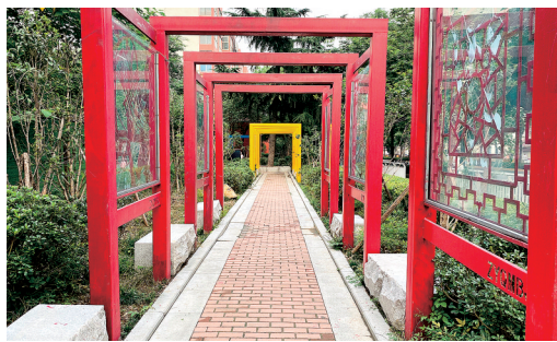
路北游园的门廊很是大气