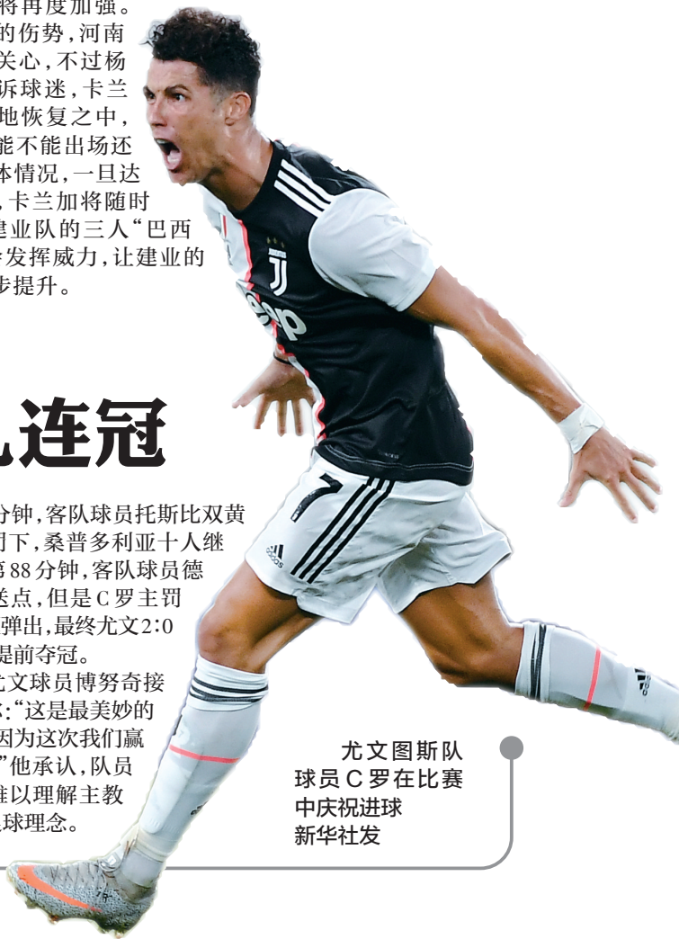
尤文图斯队球员C罗在比赛 中庆祝进球