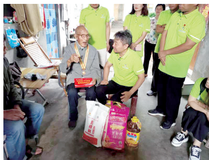
河南体彩工作人员慰问抗战老兵

百善孝为先。尊老爱老、敬老孝老不仅是中华民族的传统美德,也是中华民族的强大凝聚力和亲和力的具体体现。孟子说:“老吾老,以及人之老。”这是要求我们不仅要孝敬自己的长辈,还要尊敬社会上其他的老人。为弘扬和传递敬老爱老的传统美德,体彩人一直在行动。