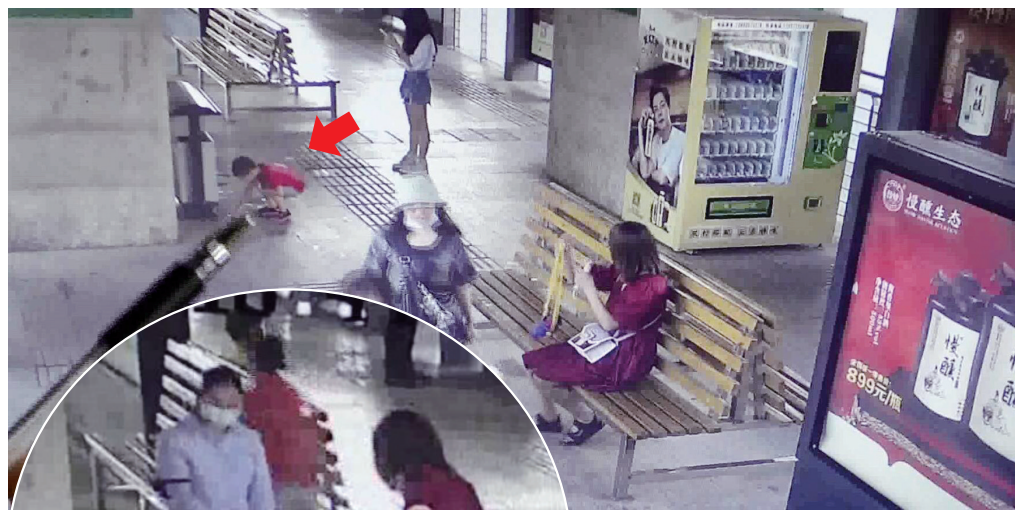
小男孩在捡碎纸屑(图中箭头处)