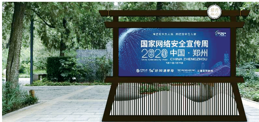
本组图片中公园网安周宣传栏均为效果合成图

本报讯(郑报全媒体记者 裴其娟 文/图)到公园游玩的同时还能学网络安全知识。昨日,记者获悉,紫荆山公园、天健湖公园等6所公园被确定为2020国家网络安全宣传周主题公园,本周将陆续进场施工,月底有望建成,下月可与市民见面。