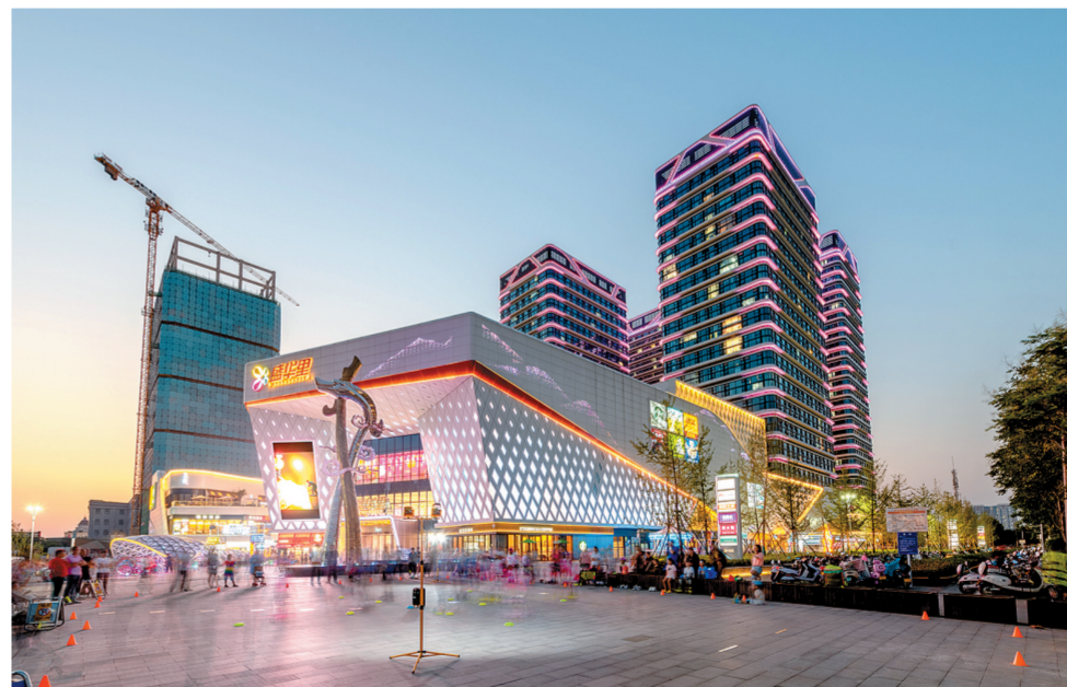
《盛华里暮色》 梁晓鹏 图