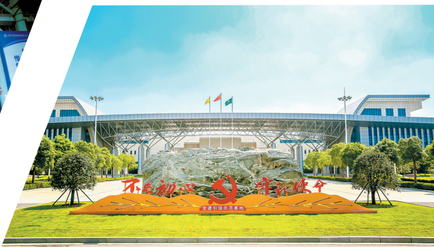
《企业新貌》 田利 图