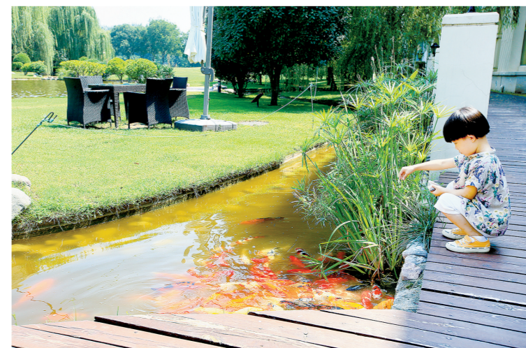
《童趣·金沙湖一角》 蒋宝童 图