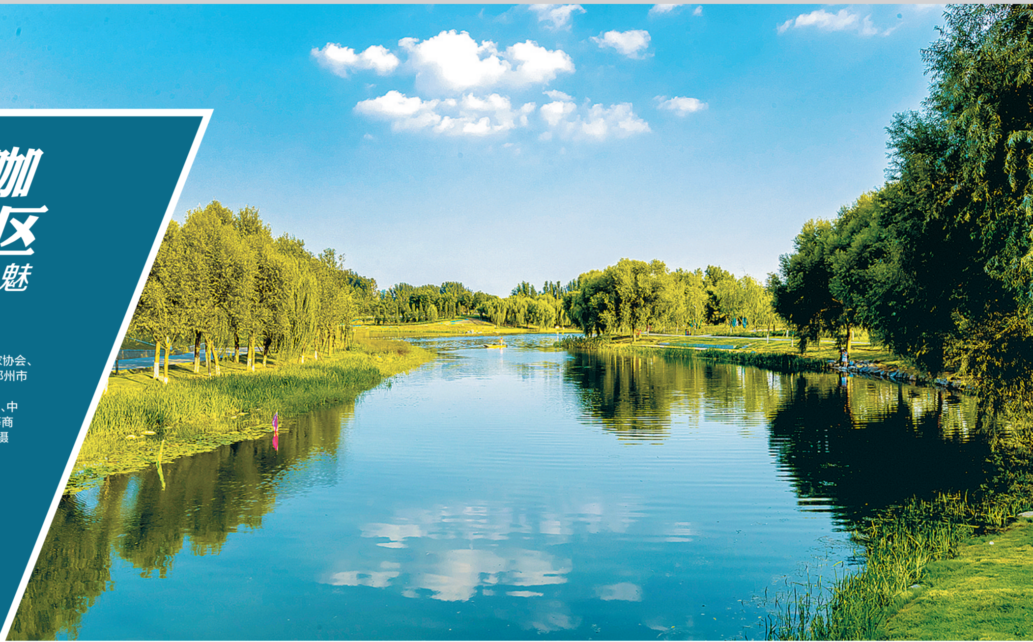
《滨河一角》 龚首鹏 图