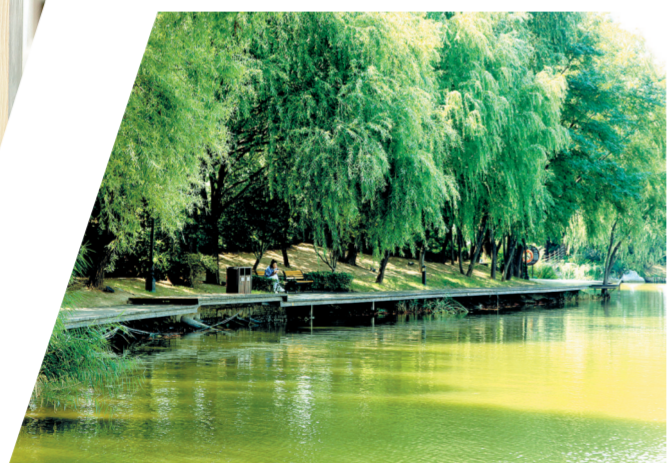
《幽静时间》 梁伟平 图