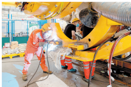
《工业时代》 梁晓鹏 图

目前,经开区以郑州跻身世界二线城市、郑州建设国家中心城市为统揽,以“东强”战略布局为指引,坚持开放创新双驱动战略,经济社会保持快速良好的发展态势。如今,经开区迎来高速发展契机,各行各业全力以赴推进各项工作,努力实现“百千万”的奋斗目标。接下来,经开区将继续为郑州国家中心城市提供有力支撑,为郑州市打造更高层次的高质量发展区域增长极贡献“经开力量”。