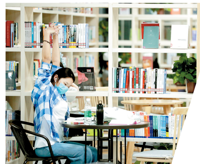
《全民阅读点亮城市之光》 聂冬晗 图