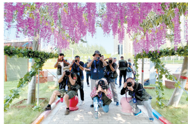
摄影大咖用相机发现经开之美