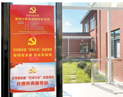
小区的“红色加油站”

自中原区老旧小区改造工作启动以来,中原区汝河路街道党工委结合党建引领“三项工程、一项管理”工作,对汝河小区来了个彻头彻尾、由内到外的“大手术”。记者9月2日来到汝河小区探访,这里路平楼新,各种精心设置的微地形绿地蜿蜒而行,健身器材一应俱全,就连空调室外机都被精心“穿上了”印有仿古体“汝河”二字的“外衣”,老人们或闲聊或下棋,很是惬意。居民们都说,现在的汝河小区摆脱了脏乱差,成为一个幸福美丽之地。记者 张改华 通讯员 李世花 李建霞 文图