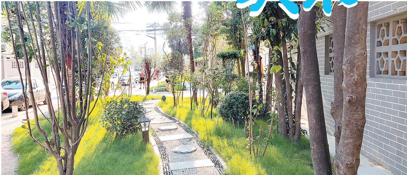
改造后,汝河小区新增了许多类似的小游园