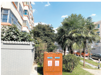
汝河小区现在楼新景美