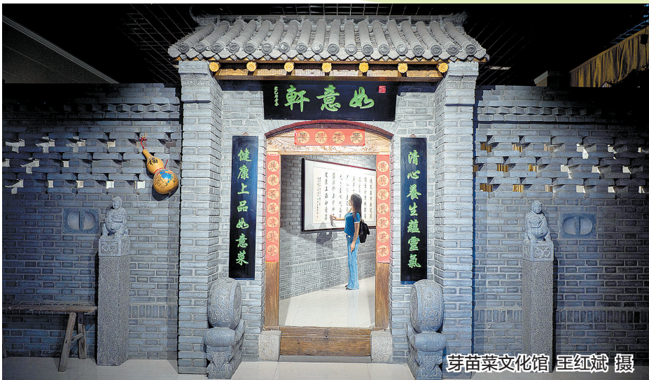
芽苗菜文化馆

本报讯 金秋九月,五谷丰登,乡村欣欣向荣。9月6日,“芽状元杯”中国农民丰收节荥阳摄影大赛启动,荥阳摄影家将用镜头记录荥阳农业之强、农村之美、农民之富。