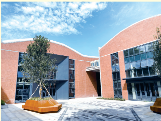
老厂房改造后成为现代办公用房