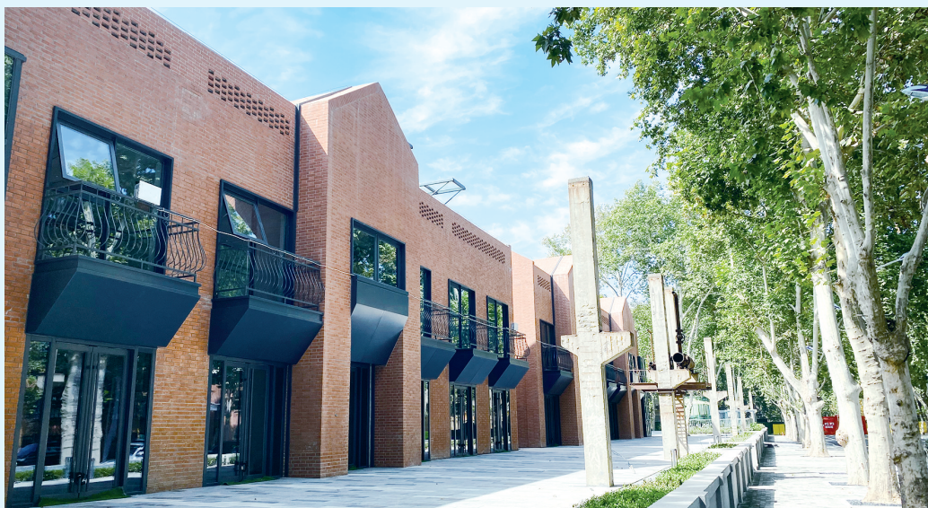
园区内时尚与工业风混搭,特色十足