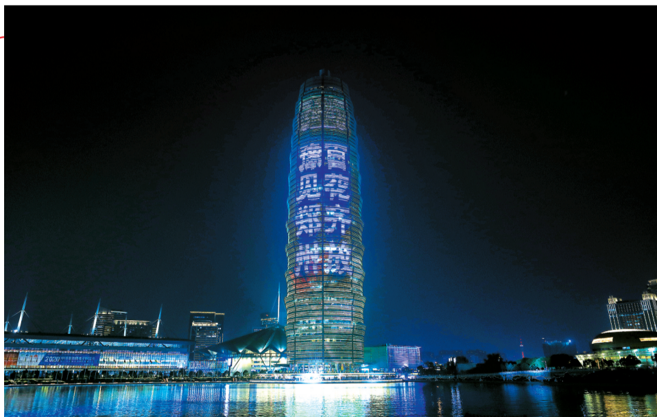
昨晚,2020年中国金鸡百花电影节主题灯光秀在郑州如意湖畔精彩上演。