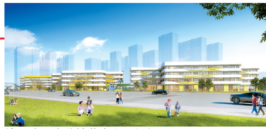
纬五路一小分校北向入口透视图