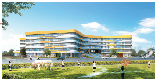
郑州外国语学校教育集团金水外国语学校主入口透视图