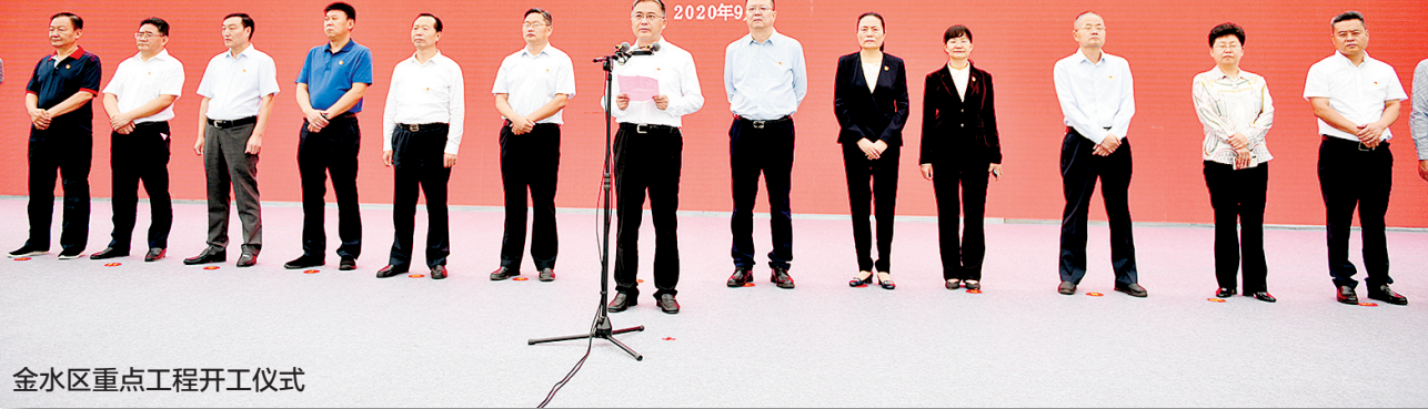
金水区重点工程开工仪式

9月29日上午10点,郑州市2020年第三批重大项目集中开工仪式圆满落幕。郑州外国语学校集团金水外国语学校、纬五路第一小学分校工程地块是金水区分会场,该工程是2020年金水区重点项目,也是郑州市重点民生设施项目之一。